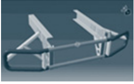
Ramschutz für Lastwagen der Deutschen Post